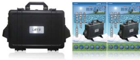
カタログ2枚分と同じくらいの大きさです。