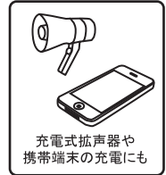
充電式拡声器や 携帯端末の充電にも

※各機器の消費電力は目安です。消費電力は製品により異なります。 ※冷蔵庫、エアコン、ドライヤー、掃除機、電子レンジなど大電流を必要とするものはご利用いただけません。