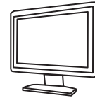
液晶テレビ (100W) 約5時間