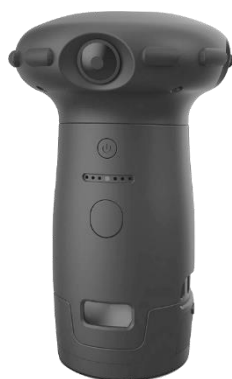
カメラ(充電電池入り)