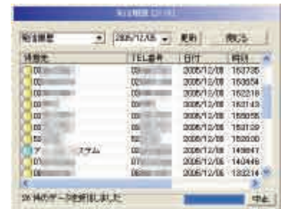
発着信の履歴も一目瞭然!